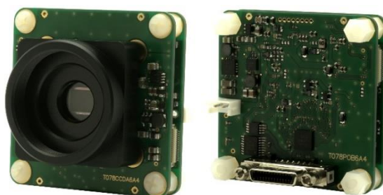
サイズ 45mm x 45mm